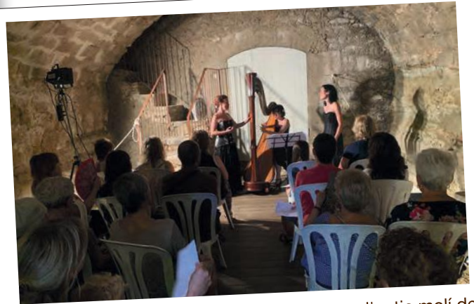
Actuació del grup de cambra, 53 Cordes, a l'antic molí de cal Gineret de les Borges