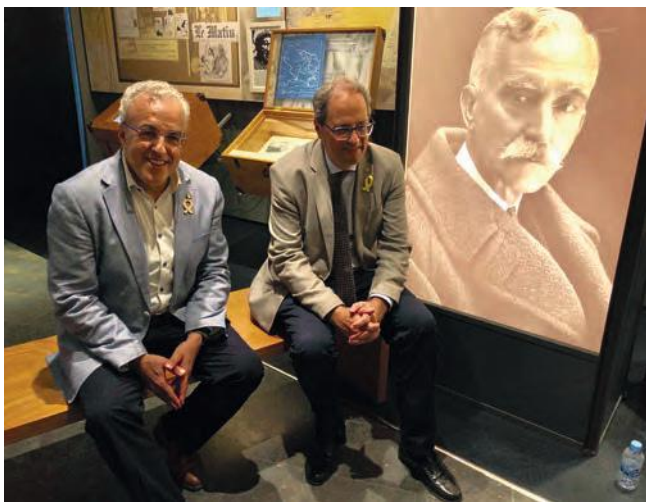
■ El President Torra va visitar l'Espai Macià

En primer lloc, en nom de les dones i els homes que formem Junts per les Borges, voldríem agrair a la ciutadania que ens hàgiu revalidat la vostra confiança i ens permeteu seguir cuidant dels assumptes municipals i defensant les Borges, per a crear-hi oportunitats de futur, progrés i benestar per a totes les dones i els homes que hi vivim. Mai fins ara un mateix Equip de Govern havia aconseguit mantenir l'alcaldia tres mandats consecutius, ni tampoc dues majories absolutes consecutives, pel que som conscients de l'honor que ens heu fet i que ara ens cal correspondre'l. En aquest sentit, dir-vos que aquesta fita que ens esperona i il·lusiona per a mantenir, com el primer dia, la nostra passió i ambició per fer de les Borges una autèntica capital també de la qualitat de vida, i la nostra vocació i voluntat de servei a la població. Per tot plegat, passo a exposar-vos les darreres novetats més destacades de l'acció municipal, i una previsió de com van les que ho seran els pròxims mesos, però ho faig reiterant-vos les gràcies per confiar en nosaltres. Estarem a l'altura de la vostra aposta per aquest estil de governar i de model de ciutat. ■