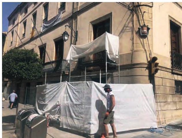
■ Restauració de la façana de l'Ajuntament de les Borges

Una altra de les prioritats d'aquest Equip de Govern ha estat i continuarà sent la millora de la imatge del nostre espai públic, dels vials i dels parcs i jardins del nostre poble. En aquest sentit, preveiem que abans de finals d'estiu s'executi l'enjardinament del Camí del Cementiri Vell, una vegada finalitzada la instal·lació del nou enllumenat del vial, fins aleshores inexistent. També en aquest àmbit, aquest 2019 preveiem dur a terme el projecte de neteja i condicionament de la Banqueta del Canal d'Urgell, al seu pas per les Borges, que faci possible la creació d'un nou espai d'oci i caminades saludables per a la població, més ample i còmode. ■