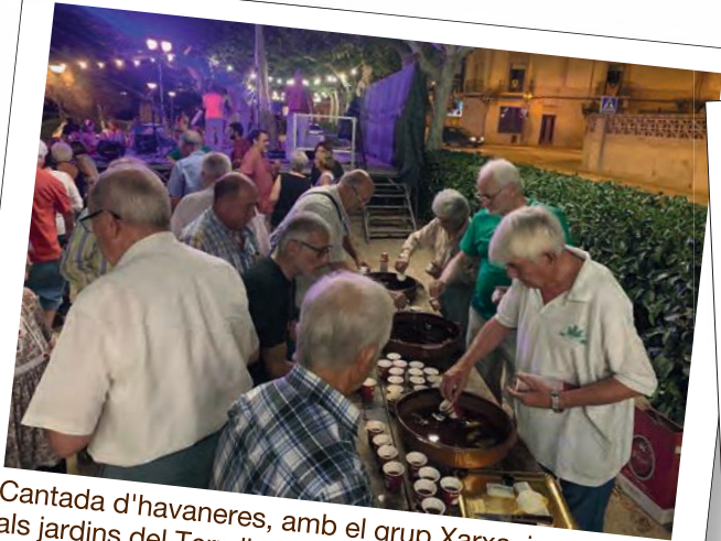
Cantada d'havaneres, amb el grup Xarxa, i rom cremat als jardins del Terrall, organitzada pels Amics del Terrall