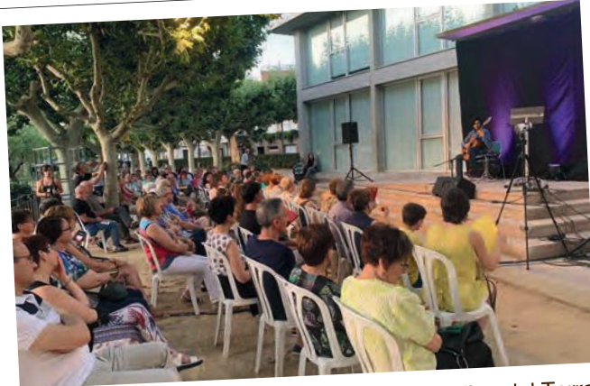
Actuació del duet Identidad Chilena als Jardins del Terrall de les Borges, en el 8è Garrigues Guitar Festival