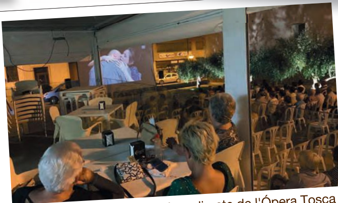
Liceu Fresca, retransmissió en directe de l'Ópera Tosca des del Gran Teatre del Liceu, a la plaça de la Independència de les Borges