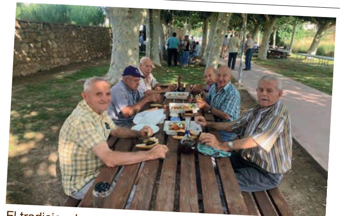
El tradicional esmorzar popular de la celebració de Sant Cristòfol