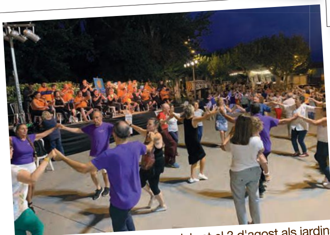
El 27è Aplec de la Sardana, celebrat el 3 d'agost als jardins del Terrall de les Borges