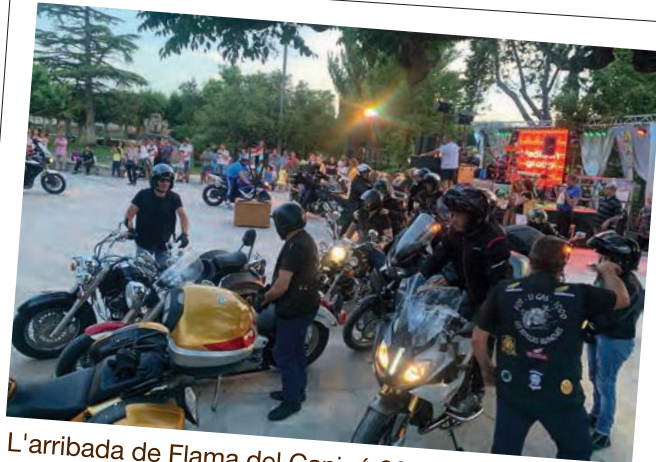
L'arribada de Flama del Canigó 2019 a les Borges Blanques