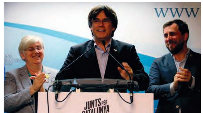
■ Carles Puigdemont, Toni Comin i Clara Ponsatí, en la compareixença la nit de les eleccions europees