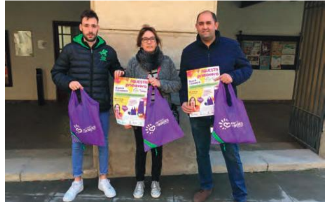
■ Presentació de la ampanya recent de l'Agrupació de comerciants on es sorteaven bosses reutilitzables de ràfia

Finalment, també se seguirà promovent el CEI de les Borges com a motor i dinamitzador de l'emprenedoria local i comarcal amb formacions útils, espais adequats i atractius, així com realitzant-hi trobades i actes periòdics amb el món econòmic garriguenc i lleidatà. ■