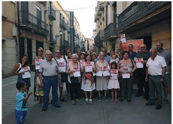
■ Els guanyadors de la campanya Barris Antics 2019 a les Borges

Pel que fa als municipis adherits a la Xarxa de Barris Antics amb Projectes, en aquesta 9a edició, són: Balaguer, Calaf, Calafell, Cardona, Centelles, Cervera, el Vendrell, Falset, Figueres, Juneda, la Selva del Camp, les Borges Blanques, l'Arboç, Llagostera, Lleida, Manresa, Mediona, Roda de Ter, Sallent, Sant Hipòlit de Voltregà, Sant Martí de Tous, Sant Quintí de Mediona, Santa Coloma de Queralt, Solsona, Súria, Torelló, Tortosa, Tremp, Ulldecona i Vilanova del Camí.