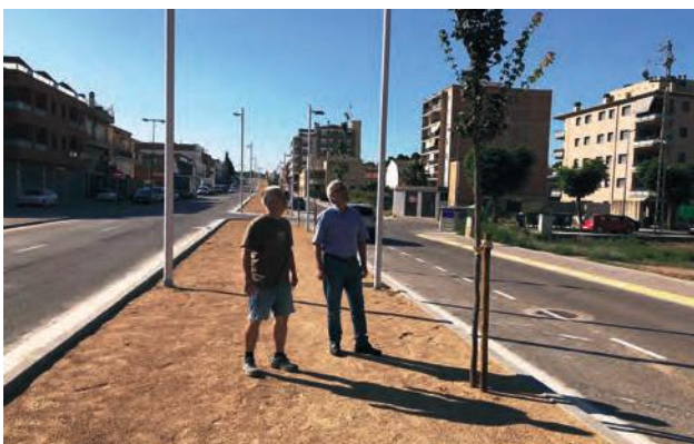
■ Visita recent del regidor d'Urbanisme i l'arquitecte municipal prèvia als treballs de finalització de la 1a fase de l'arranjament de l'Av. Francesc Macià de les Borges

En previsió, també hi ha la culminació de l'arranjament del Raval de Lleida, després de la millora feta fa uns pocs anys en la primera fase.