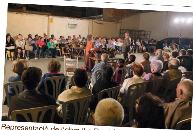
Representació de l'obra 'La Rambla de les Floristes' de Josep M. de Segarra, a càrrec de l'Agropecuària, Produccions extensives