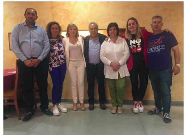
■ El nou Equip de Govern de les Borges durant la nit de les eleccions municipals 2019

En el següent requadre s'hi detallen els resultats registrats en cada una de les 7 meses que hi havia al col·legi electoral de les Borges: