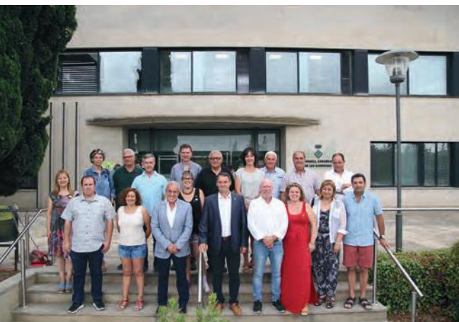
■ Les noves conselleres i els nous consellers comarcals de les Garrigues 2019-2023