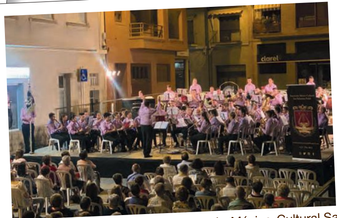
Concert Fem Banda amb l'Asociación Músico-Cultural San Sebastián de Granada, dins del XVI Festival Internacional de Bandes de Música de Lleida