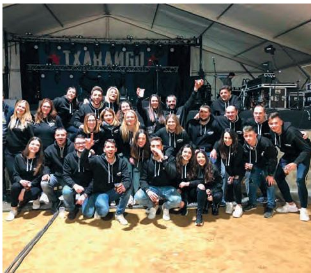
■ La Comissió de Festes que va organitzar el concert de Txarango el 20 de gener del 2018