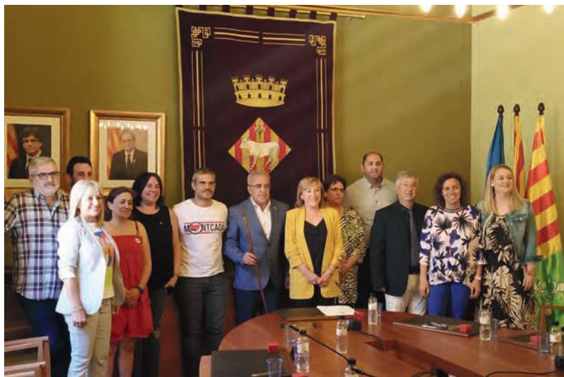
■ La nova corporació municipal de les Borges Blanques 2019-2023

T. 973 14 09 74 M. 626 30 67 63 info@construccionsparis.com