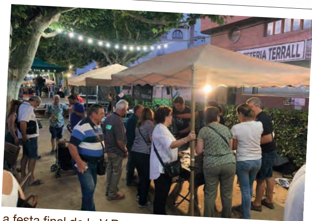
La festa final de la V Ruta de la Tapa, als Jardins del Terrall de les Borges